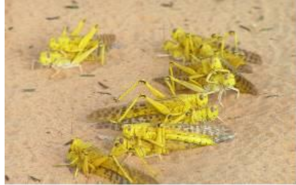
Le Criquet pèlerin : Schistocerca gregaria