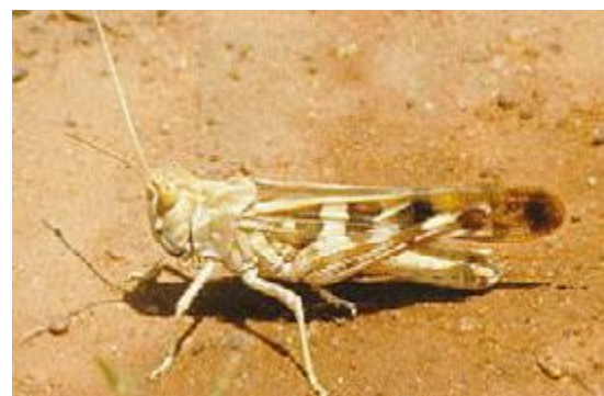
Le Criquet sénégalais : Oedaleus senegalensis