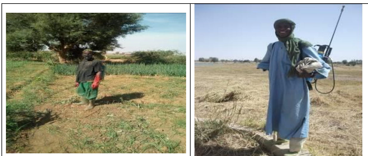
Appicateur dans la région de Tahoua (Jan. 2018)