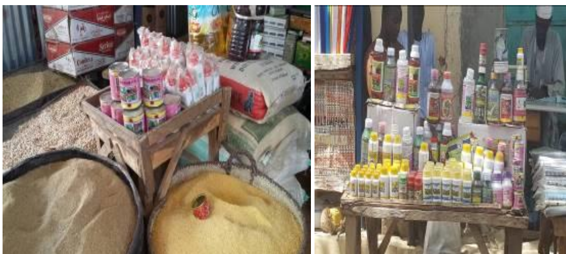
Agadez (janvier 2018)