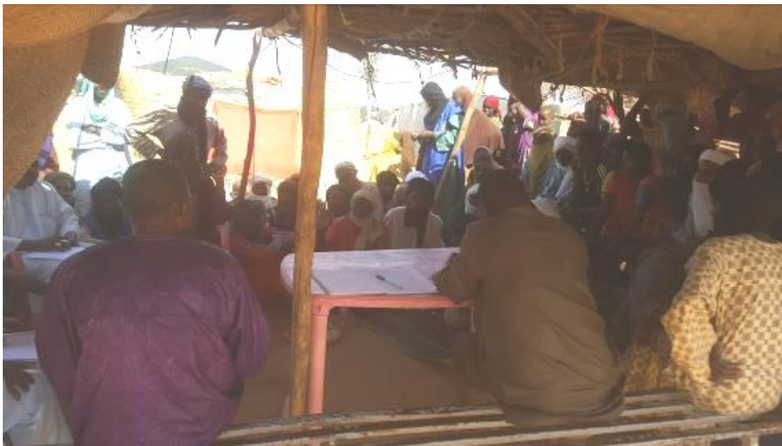
Photo 2 : Rencontre avec les déplacés du camp de Tabereybarey (Ayorou)

Les données issues des recherches documentaires, des rencontres avec les acteurs concernés à Niamey et sur le terrain ont fait l'objet d'une analyse afin de mieux orienter sur les propositions de solutions aux problèmes identifiés dans la gestion antiparasitaire, la gestion des pesticides et des déchets biomédicaux.